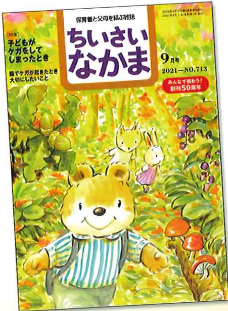
編集：全国保育団体連絡会 発行・発売：ちいさいなかま社

子育てや保育、仕事のこと、 保育の制度のこと… 一人で悩みを抱えずに、 いっしょに考えましょう。