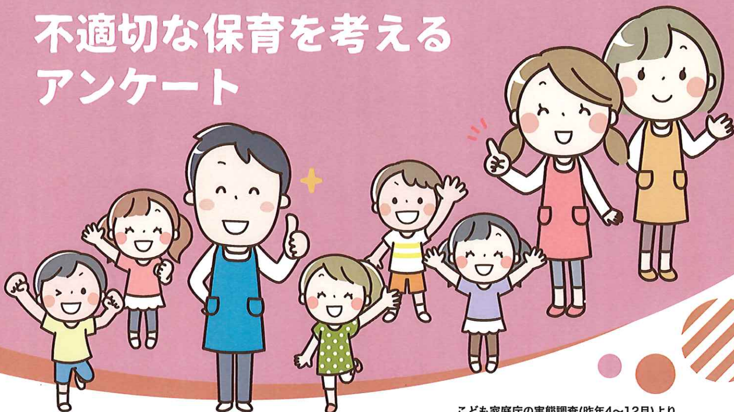
こども家庭庁の実態調査(昨年4～12月)より

こども家庭庁の実態調査(昨年4～12月)によると、全国の市町村で「不適切な保育」が1316件確認され、そのうち「虐待」は122件と深刻な事態となっています。ただし、自治体や施設によって数字にばらつきが大きく、確認されたものは氷山の一角との疑問が残ります。